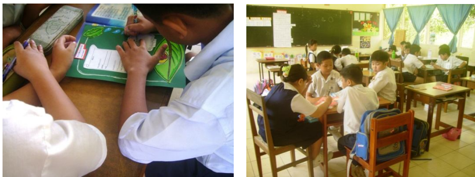
Gambar 1 dan 2: Keadaan para peserta ketika berbincang

Gambar 1 dan 2 memaparkan keadaan para peserta ketika berbincang semasa pelaksanaan teknik Round Robin dan Round Table .