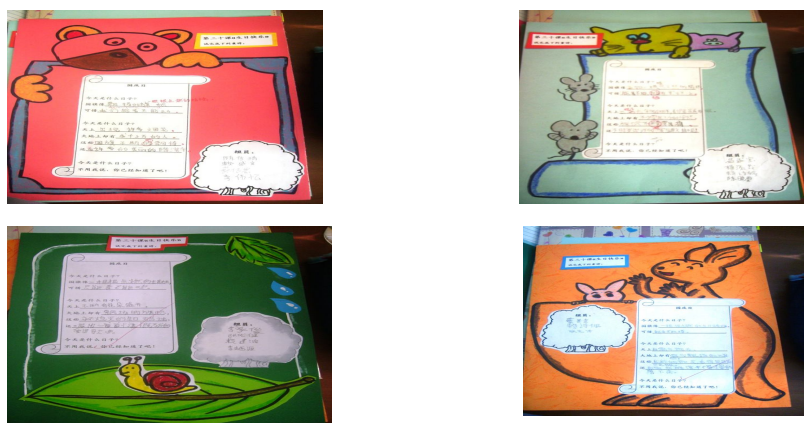
Gambar 3 hingga 6: Hasil kerja para peserta kajian

Aktiviti yang telah berlangsung juga mampu melatih peserta mendengar arahan dengan teliti dan seterusnya melaksanakan arahan dengan cepat dan tepat. Tambahan pula, sikap yang baik dalam kalangan peserta dapat disemai melalui aktiviti yang dilaksanakan. Latihan untuk mereka bekerja dalam satu pasukan merupakan salah satu ciri dalam pembelajaran koperatif. Peserta yang cerdas dapat membantu peserta yang lemah sama ada secara langsung atau tidak langsung. Perkongsian maklumat dalam kalangan peserta kelihatan mampu membuka minda mereka dengan lebih luas. Keadaan ini besar kemungkinan dapat membantu mereka untuk menghasilkan karangan yang lebih baik. Gambar 3 hingga 6 merupakan hasil kerja para peserta bagi keempat-empat kumpulan ekoran daripada pelaksanaan teknik Round Robin dan Round Table .