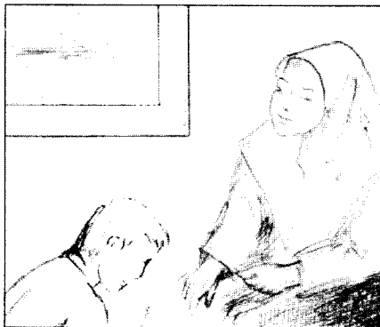
Menghormati Ibu Bapa