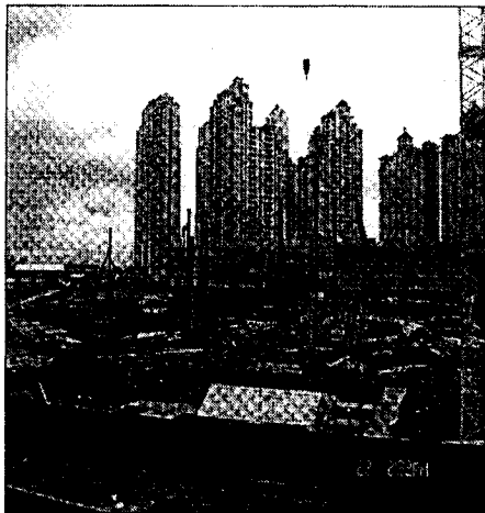
Memajukan ekonomi negara