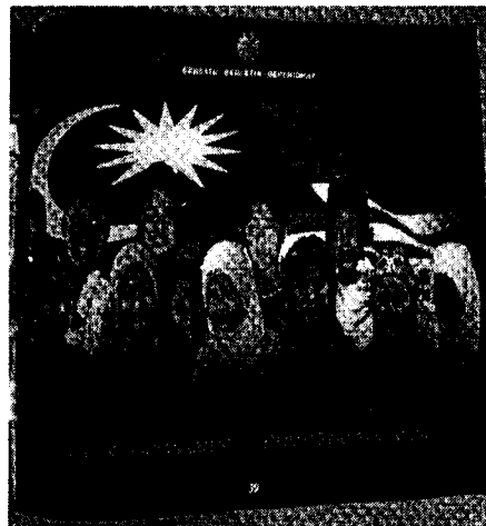
Meningkatkan keamanan negara