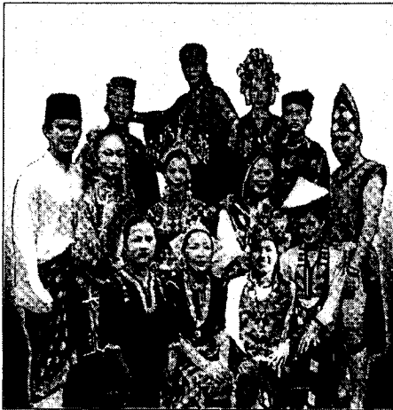
Mewujudkan masyarakat harmoni

Lihat gambar di bawah dengan teliti. Huraikan pendapat anda tentang kepentingan mengamalkan perpaduan kaum di Malaysia . Panjangnya huraian hendaklah antara 200 hingga 250 patah perkataan.